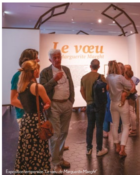
Exposition temporaire "Le vœu de Marguerite Maeght"