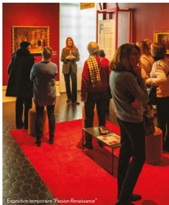
Exposition temporaire "Passion Renaissance"

Sa programmation favorise une approche diversifiée de la collection permanente et des expositions temporaires à travers un cycle de conférences, des ateliers d'arts plastiques, une initiation à la danse ou des concerts.