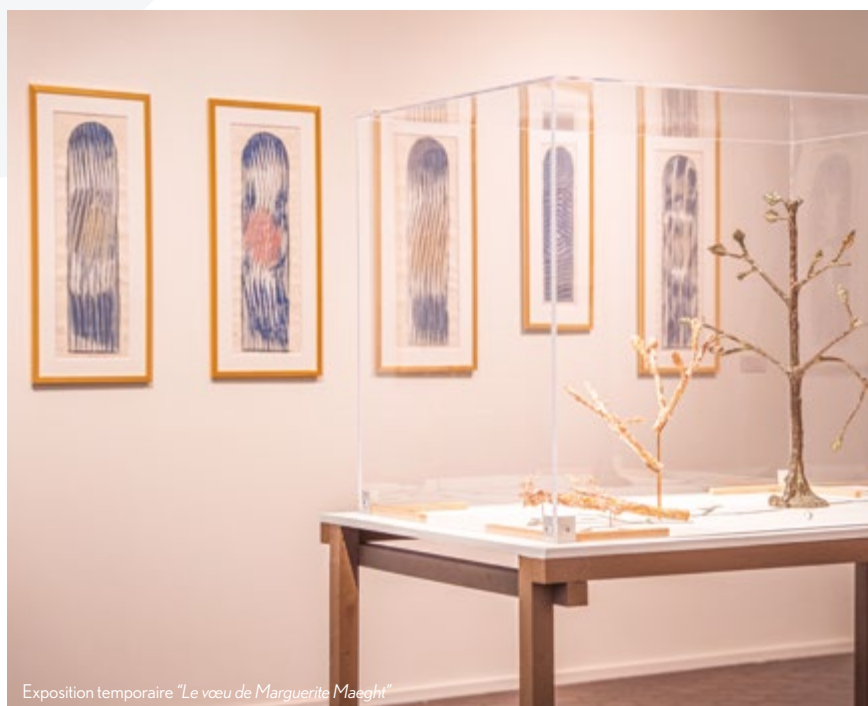
Exposition temporaire "Le vœu de Marguerite Maeght"