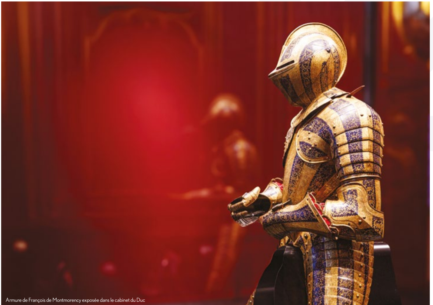
Armure de François de Montmorency exposée dans le cabinet du Duc