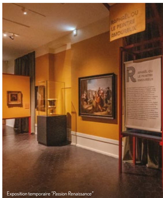
Exposition temporaire "Passion Renaissance"